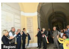
Regioni Cainero, Fedriga "Eredità del suo impegno è ricchezza più grande"