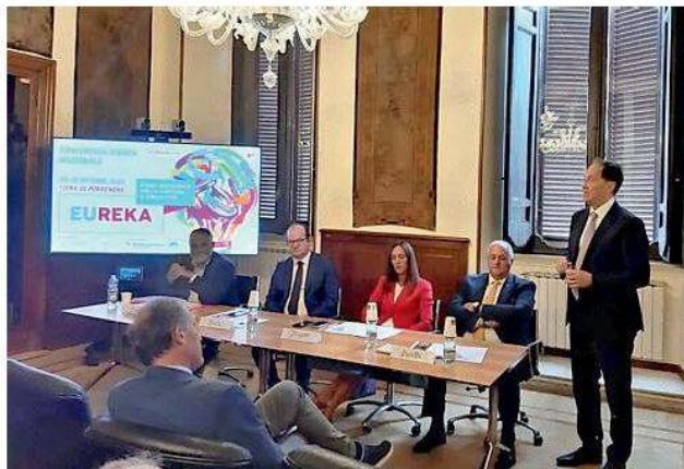
Gli intervenuti alla presentazione di Eureka a Roma

«Eureka 2024 rappresenta una vetrina unica per la valorizzazione della cultura e dei prodotti creativi come settore economico fondamentale per il sistema Paese. La Regione Friuli Venezia Giulia ha puntato sulla cultura, creando nuove opportunità di lavoro, sinergia e innovazione. Con Eureka intendiamo dare concretezza a questa visione, offrendo un palcoscenico di rilievo a tutte le imprese italiane che operano nel settore e favorendo la nascita di nuove collaborazioni anche a livello nazionale e internazionale». Lo ha dichiarato il vice-governatore del Friuli Venezia Giulia, con delega a cultura e sport, Mario Anzil, a Roma, nella sede della Regione, nel corso della presentazione di Eureka, la fiera nazionale della cultura e della creatività, in programma il 29 e 30 ottobre alla Fiera di Pordenone. L'iniziativa, giunta alla seconda edizione, è promossa dalla direzione Cultura e sport della Regione ed è realizzata grazie alla collaborazione di Pordenone Fiere.